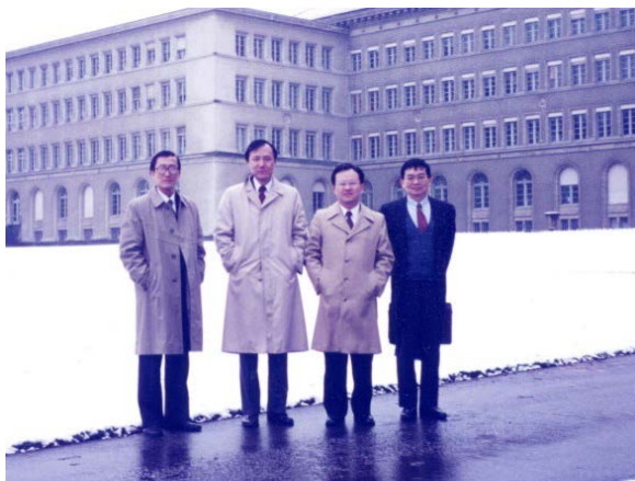
1995 年日內瓦 WTO 會議

為何要訂定政府採購法呢？政府用於採購的資源約佔國民生產毛額的 10%至 15%。政府的採購原係依據「審計法」、「審計法施行細則」、「機關營繕工程及購置定製變賣財物稽察條例」辦理。但由於時代變遷，原有採購的相關法規已不敷需要，各方時有改革之議。且當時我國欲申請加入「世界貿易組織」(WTO)，但各國皆以開放市場為由，堅持我國必須簽署「政府採購協定」(GPA)，並配合完成相關國內法之修訂，方支持我國入會。經過