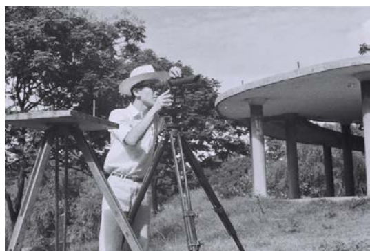
成大土木測量實習