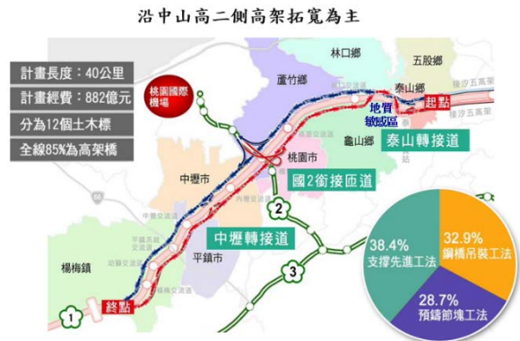
五楊拓寬工程計畫概要

綜整以上，李董事長認為重大公共建設的推動，要有穩定的環境及政策，而採購只是其中的過程，不可能一成不變。事前的策略規劃及簽約後的執行必須務實面對。在商業的世界裡，變化無窮，若只重防弊就會裹足不前，將犧牲興利與創意，唯有強化本身的體質才是根本。工程進行過程中要能承擔責任、為所當為、權責合一，對於任何決定需有明確的理由，更應留下完整的紀錄。