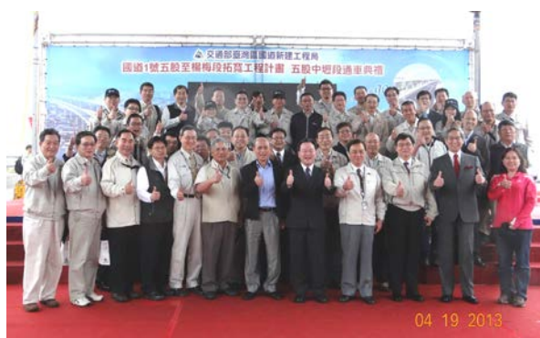
五楊五股中壢段通車典禮