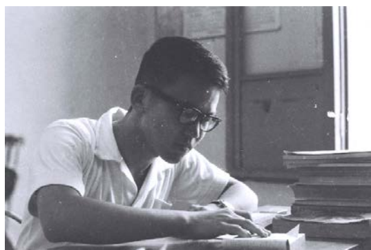
大一於成大宿舍留影