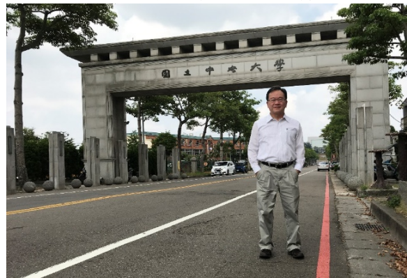
攝於國立中央大學大門口