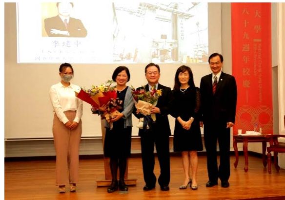
2020年獲頒成功大學傑出校友

2001年因應國家社會對於營建管理人才培育與研究發展之需求趨勢，成立了獨立於土木系之外的營建管理研究所，是國內營建管理領域第一個於國立大學成立的獨立研究所，李董事長為第一任所長，雖都在學術界，也算是成功的轉換跑道。