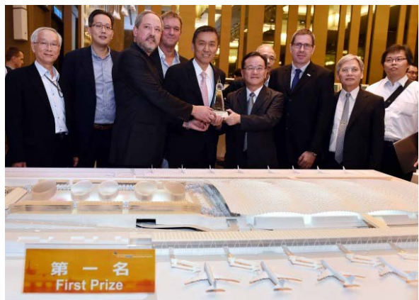
親自上陣帶領公司得標的 T3 團隊合影