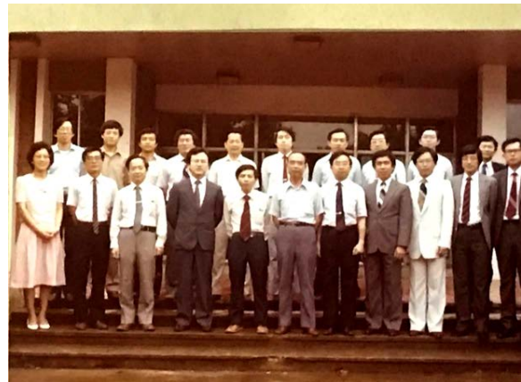
1985年中大土木系教師合影