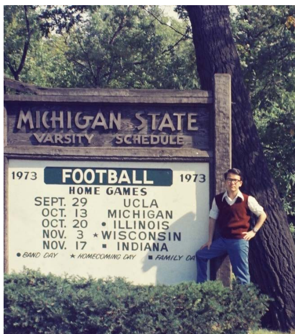
美國密西根州立大學