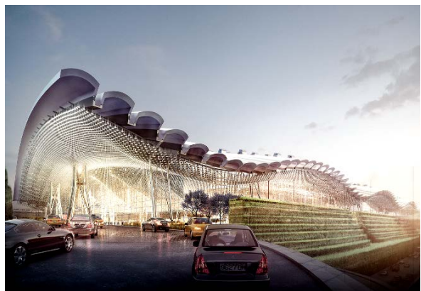
桃園國際機場第三航廈工程(T3)