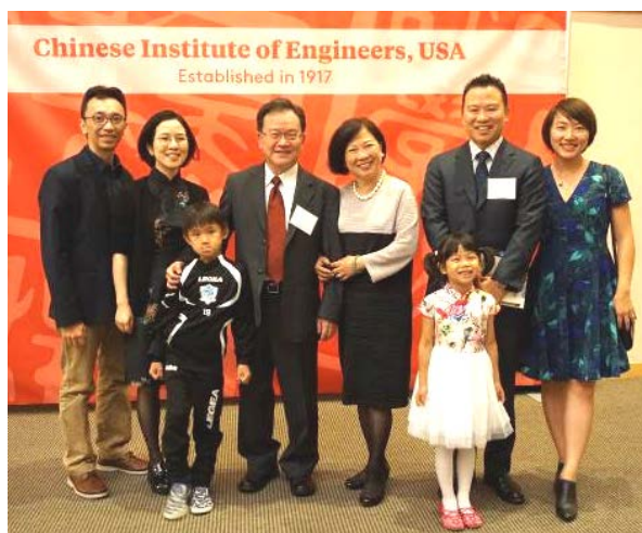
2017 年獲頒美洲中工會百年獎章全家合影