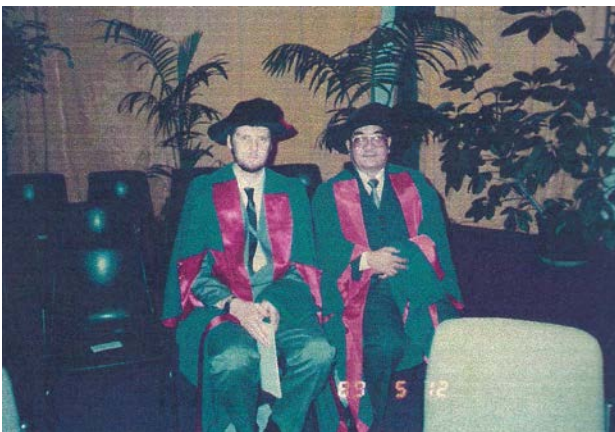
澳洲臥龍崗大學土木系攻讀博士學位畢業典禮照；當年有二位獲得博士學位(民 78 年 5 月 12 日)