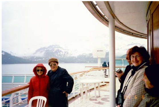
阿拉斯加太陽公主號郵輪旅遊(民 93 年 6 月初)