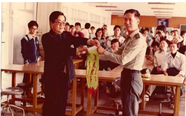
成功大學土木系學生參訪陸軍官校

而在成大研究其間，主要研究題目包括砂土彈塑性行為與模式、砂土承受動載下液化行為、高雄過港隧道下方液化地盤改良工法與防治、地質改良與其機理研究、地下水抽取對極軟弱土壤行為模式研究等。