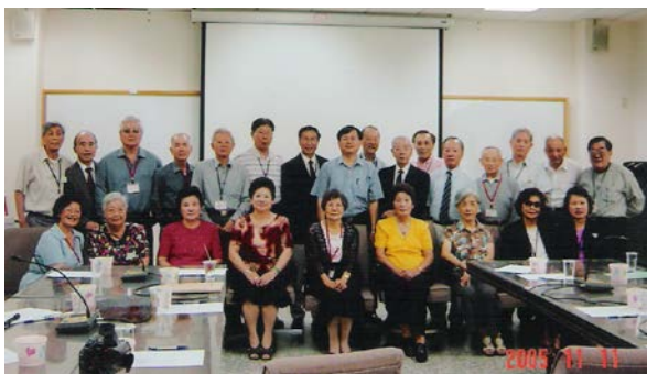
民 44 級國內外級友伉儷返校訪問成大土木系團體照慶祝畢業 50 周年紀念 (民 94 年 11 月 1 日上午)