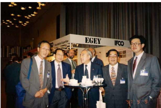
第 14 屆土壤力學與基礎工程國際研討會 (德國漢堡市，民 86 年 9 月 9 日)