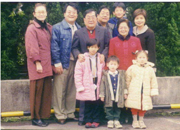
全家福陽明山旅遊合影(民 90 年 6 月)