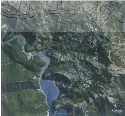
圖一 Google-Earth 衛星影像

深度只及滑動面的撕裂線。換句話說，B層應是被斷層所錯斷，而不是因為梨山地滑造成其錯斷；所以推測B層是穩定的應屬合理。但是A層與B層之間所夾的相對軟弱岩層則是不穩定的；它們是屬於逆向坡的滑塌（Slump）類型。從宏觀的尺度來看，A、B、C三層同屬一種岩性，因為它們都是耐侵蝕的相對堅固岩層，所以地形比較凸出，可以當作指準層（Keybed）；在層序上，以A層為最老，B層次之，而C層最年輕。其中B層在H附近呈現迴轉彎的特徵；這乃是典型的褶皺構造，而且是背斜構造，因為最老的A層位於核心部。C層則在H附近被梨山斷層F-F所截斷；由此也可證明梨山斷層是存在的。如果背斜的推測是正確的，則上述三條撕裂斷層應是背斜翼部的剪切斷層，而不是逆衝斷層所造成的撕裂斷層。