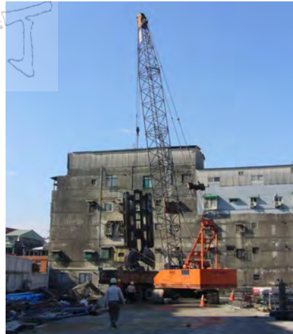
圖八 ML工法履帶起重機形式

台灣連續壁工程施工用的履帶式起重機由於同步系統的因素常用Hitachi品牌，除了上述的Hitachi SCX-900HD-2型外(永日建