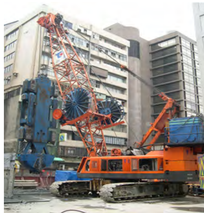
圖九 MHL工法履帶起重機形式-後方放置油壓動力箱

設機械股份有限公司，2016)，還有Hitachi SCX-800、SCX-900、SCX-800HD等配合連續壁工程設計口徑需求選擇吊車及吊臂長度來配合施工。