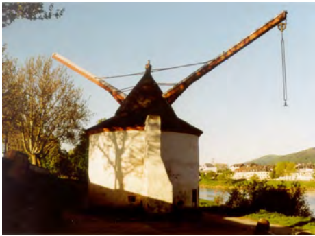
圖四 1413年德國特里爾內港的塔吊

隨著工業革命的到來，被用來在碼頭裝卸貨物的第一台現代起重機正式產生。1838年，工業家、商人威廉·阿姆斯特朗男爵設計了一台液壓式水力起重機。在他的設計中，用一個在密閉圓柱缸中的柱塞來產生承載能力，而通過閥門調節缸中液體量來賦予柱塞所需的力，如圖四所示。