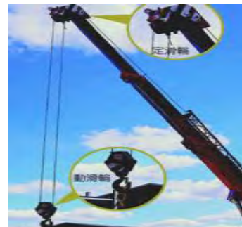
圖五 起重機原理-滑輪及液壓缸的組合 (引自維基百科~起重機)

(3) 液壓缸：可直接用於提升負荷，或間接移動承載了另一個提升裝置的起重臂或梁。像所有的機器一樣，起重機也遵循能量守恆定律。這意味著輸出給負載的能量不會超過輸入機器的能量。例如，如果一個滑輪系統能夠提供10倍的施加力，則負載動作的距離就會只有施加力的十分之一。因為能量正比於力和距離的積，輸出能量被保持大致等於輸入能量。