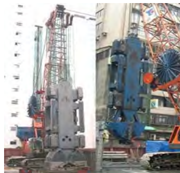
圖七 MHL工法設備機器

從上述分析，最佳連續壁施工法首推SHB工法，SHB (San-Ching hydraulic bucket)係利用MHL(Masago hydraulic long bucket)油壓長壁挖掘機掘連壁的一種工法，MHL之裝置是要配合目前興起的超高層建築物或大型基礎工程而設計，主要在利用此種挖掘裝置達到較高精度及效率，而其挖掘的深度也較其他工法深，可達地下55公尺，設備機器如圖七所示。