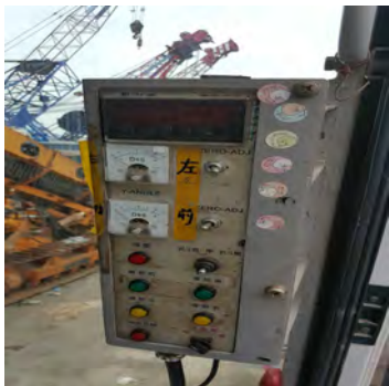
圖十二 履帶起重機SCX-900HD-2 駕駛室中加裝MHL控制箱