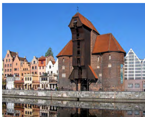
圖二 中世紀港口起重機

相對於現代起重機，中世紀的起重機和更接近它們在古希臘羅馬時期的前輩，主要用以垂直吊裝，而非水平搬移。因此當時吊裝作業的方式與現在是不同的，例如，在建築工地，吊車將石塊從下方直接吊裝就位，或者從牆的中間為兩端吊運石頭。另外，起重機司機在起重機外面向踏輪工人下達命令的同時，還可以用一根細繩控制著吊物的水平移動。