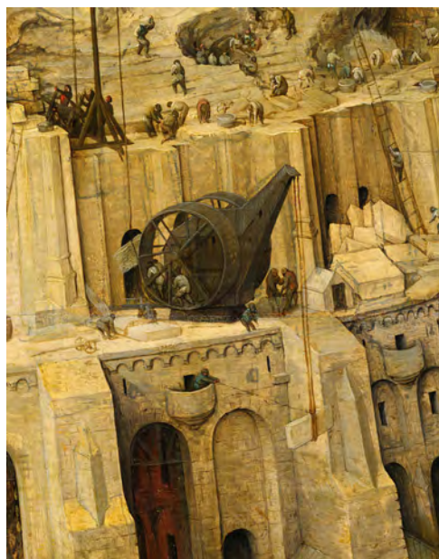
圖三 踏輪起重機