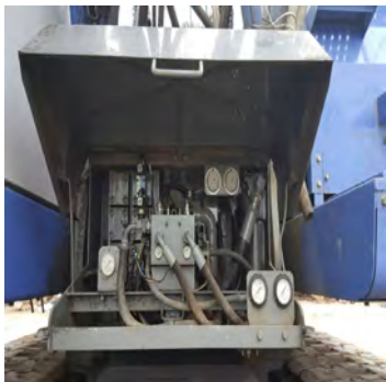
圖十一 履帶起重機SCX-900HD-2 增加控制閥及油管