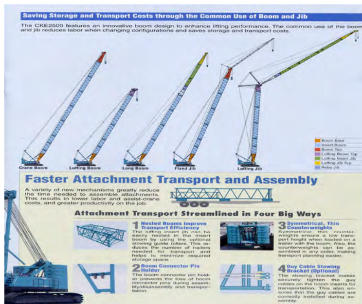
圖六 履帶式起重機吊臂形式 (引自日本KOBELCO CKE-2500型錄)

履帶式起重機吊臂形式依不同模式區有主桿(crane boom)、副桿(fixed jib)、延伸桿(luffing jib)等形式如圖六(民昌企業有限公司，2016)；其中延伸桿(luffing jib)形式依長度需再增加捲揚機的數量及鋼索長度來配合。